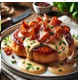
kurací steak na slaninej omáčke