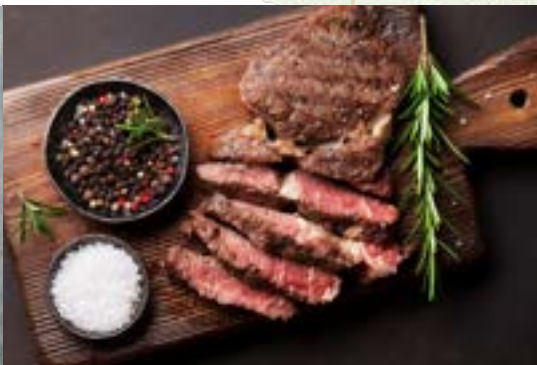
hovädzÍ pfeffer steak