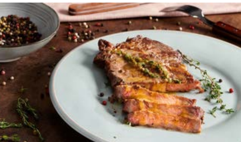
divinový steak na farebnom korenÍ