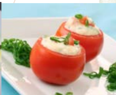
paradajky s nivovou penou