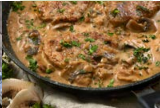
bravčové plátky na hríbkovej omáčke