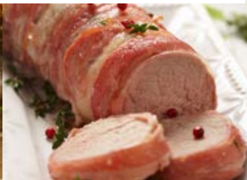
bravčová panenka v slaninovom kabátiku