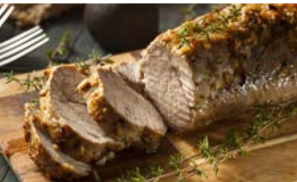
bravčová panenka na rozmaríne